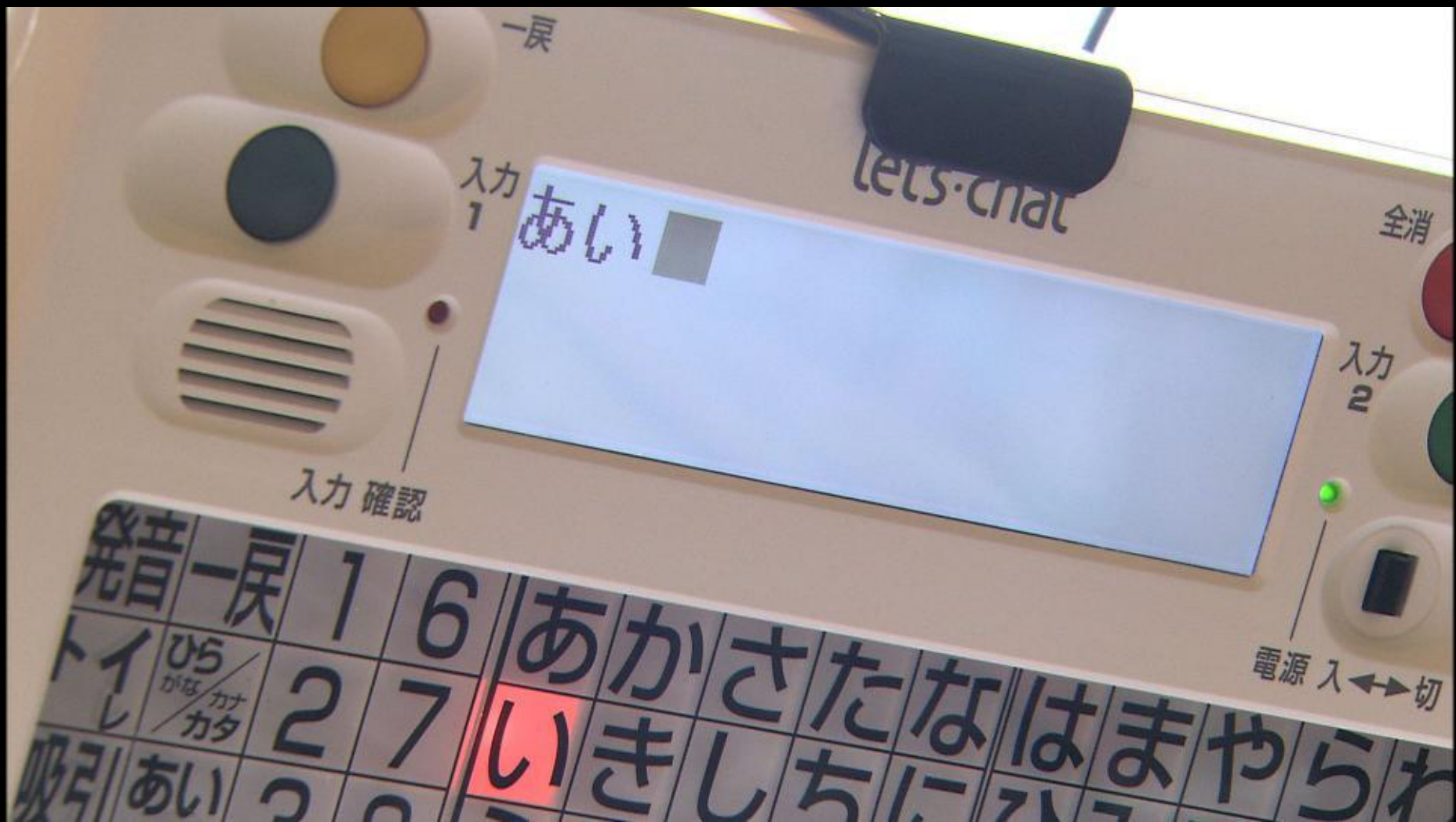
Japanese communication aid, "Let's Chat"