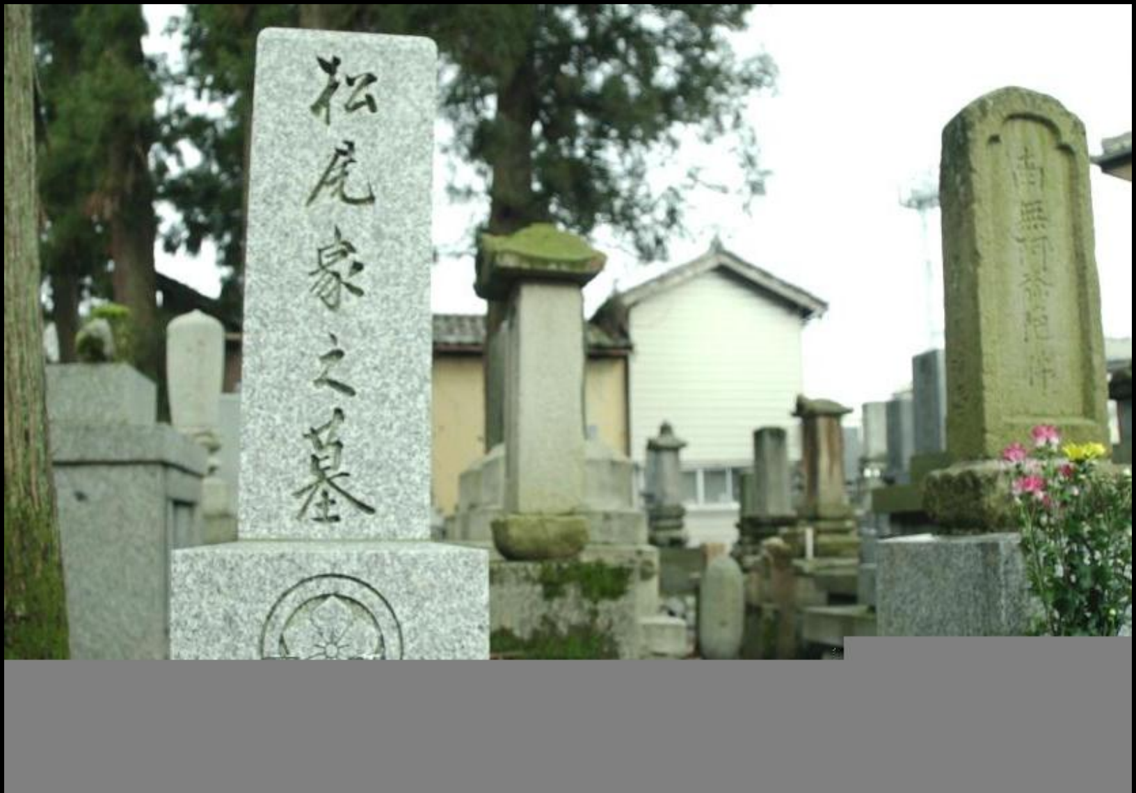
Our grave (left) next to Matsuo ancestors' grave built in 1850 (right)