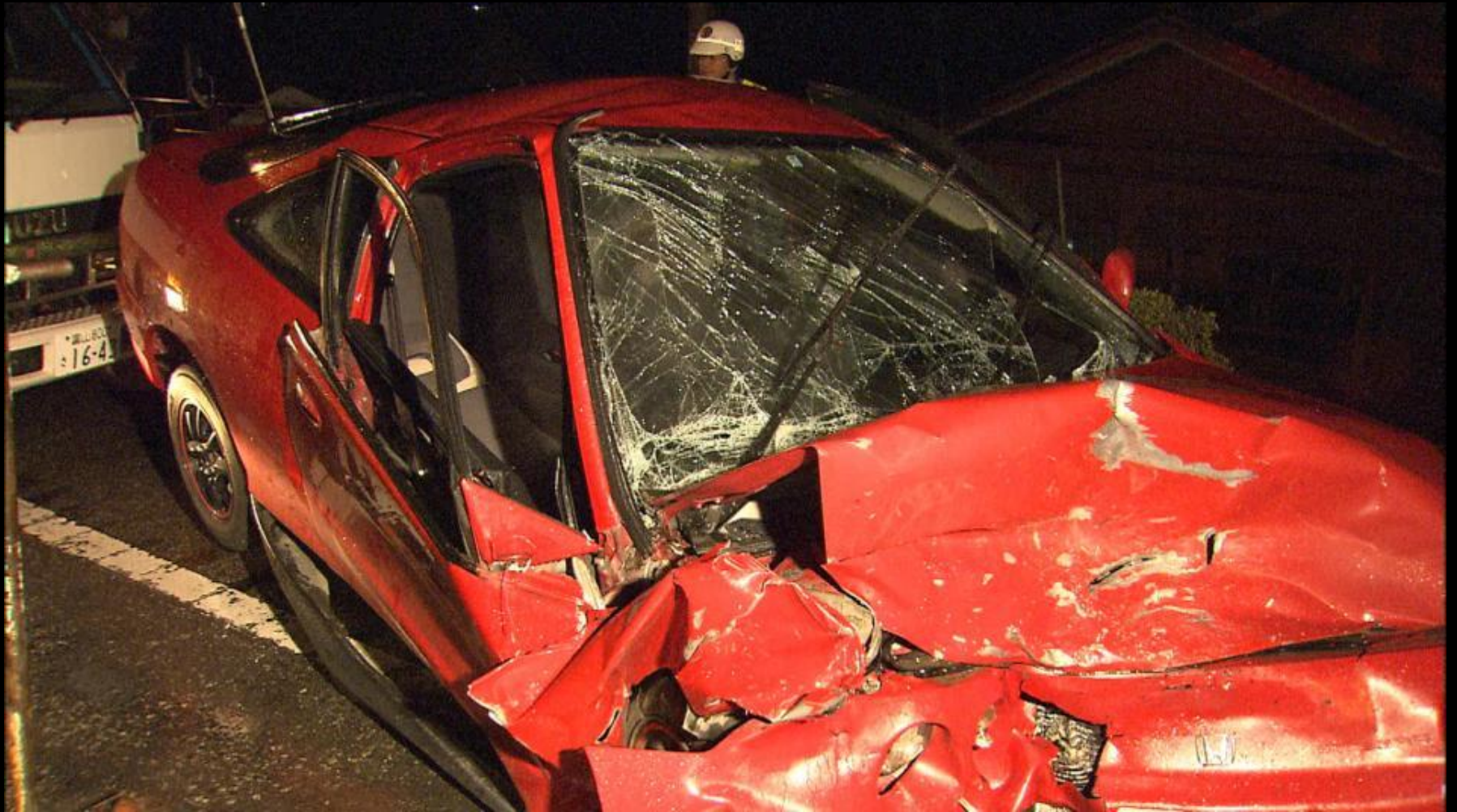
Accident scene: July 1, 2006 8PM